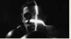
EROTICA (MADONNA'S CELEBRATION TOUR) RICARDO GOMES 00:05:00