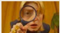
GUIDE TO SELF-ESTEEM TATIANA PELLICANÒ 00:01:54