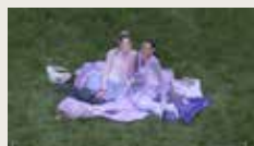
THE GRIP OF FEAR ALENA PLOSKI, GUILLAUME JOLLY 00:04:38