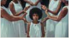
THE RIVER HERRANA ADDISU 00:17:33