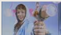
HUMANI BLASTER YANGYANG WU HUMANI 00:03:11