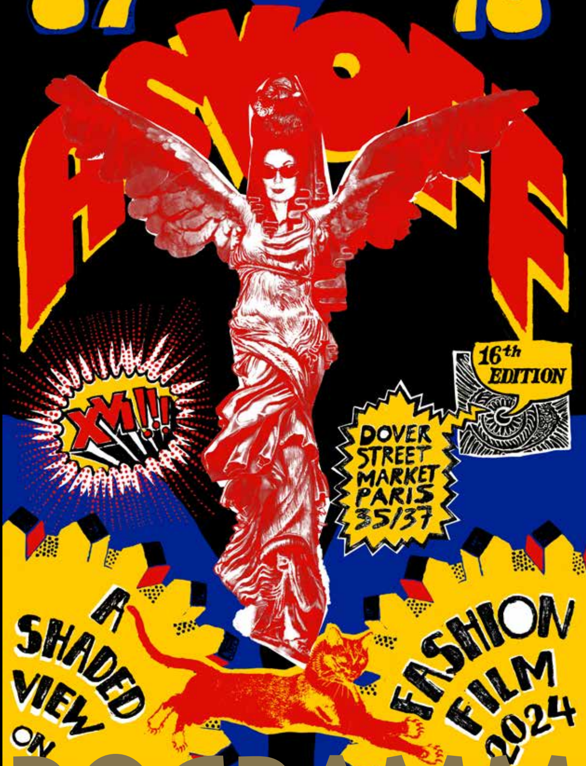
Illustration de couverture par Miguel Villalobos