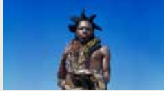
DESIRE MAREA BE FREE IMRAAN CHRISTIAN 00:08:11