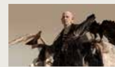
INERTIA OF SAMBARA YANG HU, SHAN HUA 00:01:49