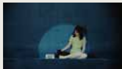
EMILIA AND THE CAT SIMONE STEFANO, POZZI YANG 00:02:00