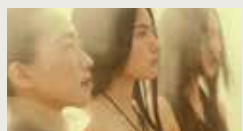
WORLD TREE XUNZI WANG 00:30:19