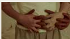
STRINGS OF ATTACHMENT GIEUN CHAE 00:02:08