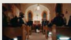
SAFE FROM HARM WILLY CHAVARRIA 00:13:49