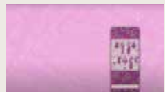
WHY BUY? IS SOCIAL MEDIA MAKING US SHOP MORE? CODY O'CONNOR 00:13:07