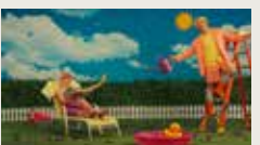
ARTIFICE KATE HARPOOTLIAN 00:06:26