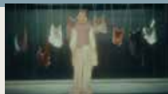
SHIMBALAIE MATTEO FRASCA 00:05:11