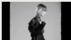
WHODUNIT SASHA LIST 00:01:13