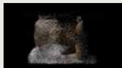
ASTERISK'S ODYSSEY YILIN DU, KE PENG 00:02:00