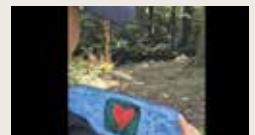
CLIMATE WARRIORS XOCHITL BARAJAS VAZQUEZ 00:00:30