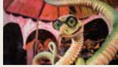
MIC-MAC AT CIRQUE DU FREAK MELODY LEMOON BOSSAN, ETHEREAL GWIRL 00:02:34