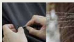
ERDOS X RUOHAN AW 2023 ERDOS 00:00:43