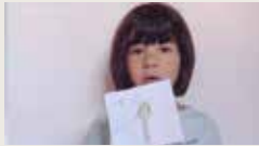
LOVING KINDNESS FOR EARTH SOA 00:00:31