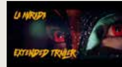
LA MIRADA TRAILER MATT WILLIS-JONES 00:03:30