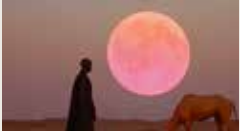
STILLNESS NORA HASE 00:01:30