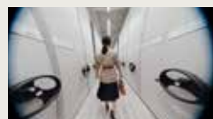
PRADA SS25 JIA LING JOHN MURD 00:00:40