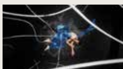
UNSHELLED CHUNQI ZHAO 00:04:20