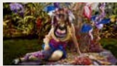
THE DREAM-QUEST OF UTATH NINGXIN ZHANG, RUNQING YU 00:04:25