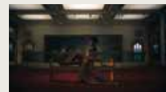
UNDER THE SKIN OF A GUILD: WAKE OF LOST SOULS FREDDIE LEYDEN 00:04:10