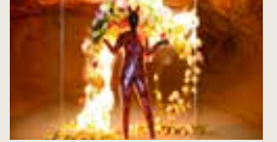
RUNWAY.EXE PETRA 00:02:16