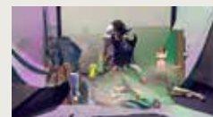
GREEN DEAL ROM DZIADKIEWICZ UKRAINATV 00:08:00