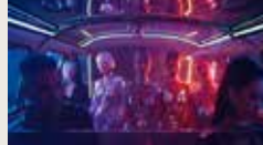
RAGE MONEY POWER DAVID KYUNG-MIN SHELDRICK 00:01:17