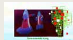
BLOMSTRA I TROLLHÄTTAN JENNIFER-ANNELIE SÄLSSI 00:04:12