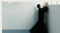
THE ABSENT GESTURE DAVID PAIGE, CYPRIEN BOURREC 00:01:51