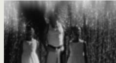
PARADISE CHILD 00:04:11