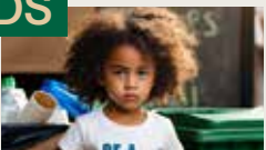
CLIMATE WARRIORS XIAN JOHN FERNANDO 00:00:30