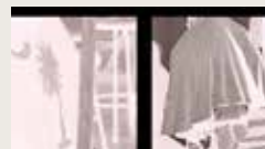
ALL THESE ARID PLACES - CHRONICLE ONE K. S. TEHARA 00:00:56