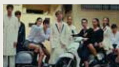
CASERTA ROYAL MICHEL HADDI 00:02:57