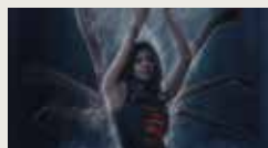
GIRLS OF HORROR ALYN HORTON 00:02:05