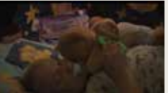
HAPPY HAPPY BABY JAN SOLDAT 00:20:00