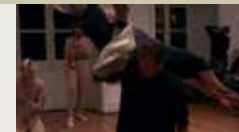
WHAT WOULD YOU DO FOR LOVE OF COUNTRY? (THE SIVENS EXAMPLE) JEREMIAH DAY 00:09:06