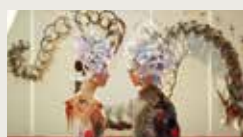
FORBIDDEN REVERIE YISONG HUANG 00:04:00

Depuis les années 2000, la mode chinoise a prospéré, portée par des marques nationales et l'exploration du style personnel. La mode évolue rapidement, propulsée par les réseaux sociaux et une population jeune. Les jeunes designers mettent en avant l'innovation. Le cinéma capture cette explosion culturelle, offrant une vision complexe et créative du monde dynamique de la mode chinoise, où tradition et modernité se rencontrent.