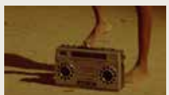
RED CASSETTE VICTOR BASTIDAS 00:14:42