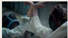
DECHAMPS "EN GARDE" SS25 COLLECTION FILM LUCAS BECCARO 00:03:48