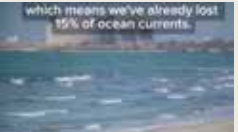
THE DAY AFTER TOMORROW SUZANNE VEURIOT 00:00:30