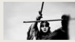
ÜBERMENSCH (OVERMAN) TIM YIP 00:03:11