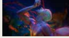
PARADISE GARDEN - JEAN PAUL GAULTIER JENNY BROUGH 00:00:32