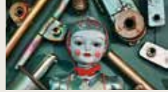
LOVE BYTES: AI-MEE IS HEARTLESS MELODY LEMOON BOSSAN, ETHEREAL GWIRL 00:03:00