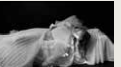
SWIM PETER SPANJER 00:08:02