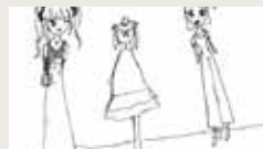
FUTURE STARTS TODAY BIANCA PAKUSEVSKIJ 00:00:30