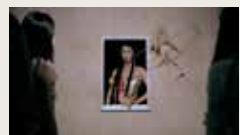
IF I WERE A SHOWCASE JIE ZHOU 00:03:12