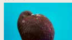
WHEN DOVES TRY THALIA DE JONG 00:02:32