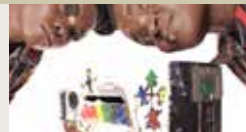
THE CULTS DANI PLOEGER 00:06:11

(TÉLÉ)CHARGÉ DU CORPOREL AU VIRTUEL INTRO PAR ALEX MURRAY LESLIE MURRAY