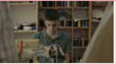
CIRCLE FERHAT ERTAN 00:09:38